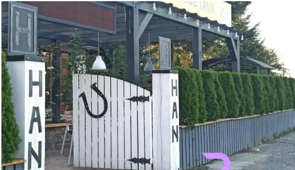
Hanul galben con?e?ti