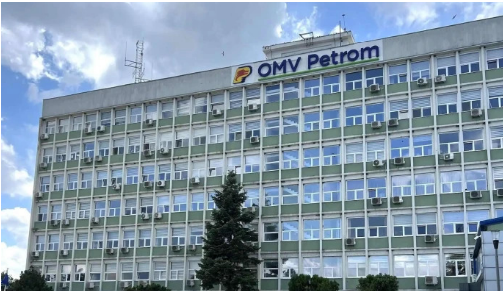
Omv petrom cum s? ajungi acolo