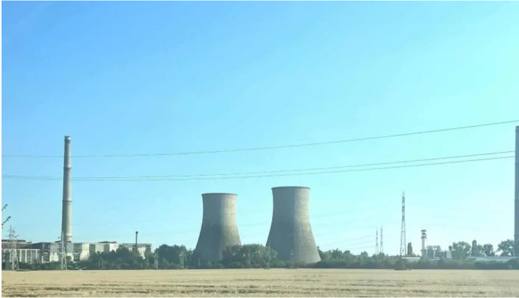
Omv petrom fotografii