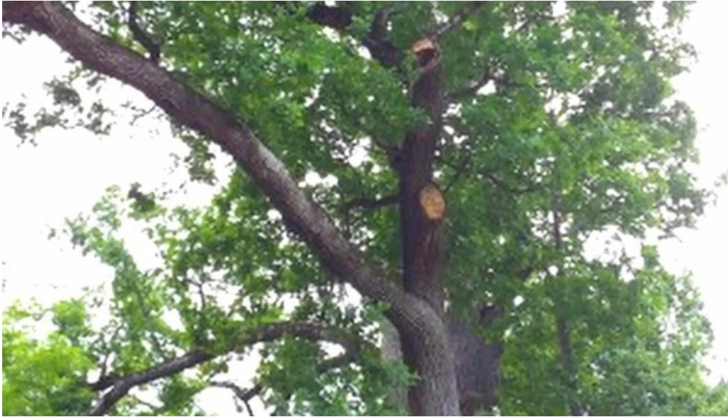
Stejarul de la cocorastii mislii dc133