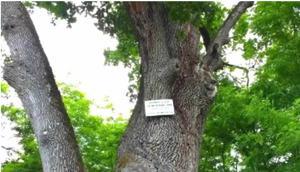
Stejarul de la cocorastii mislii telefon