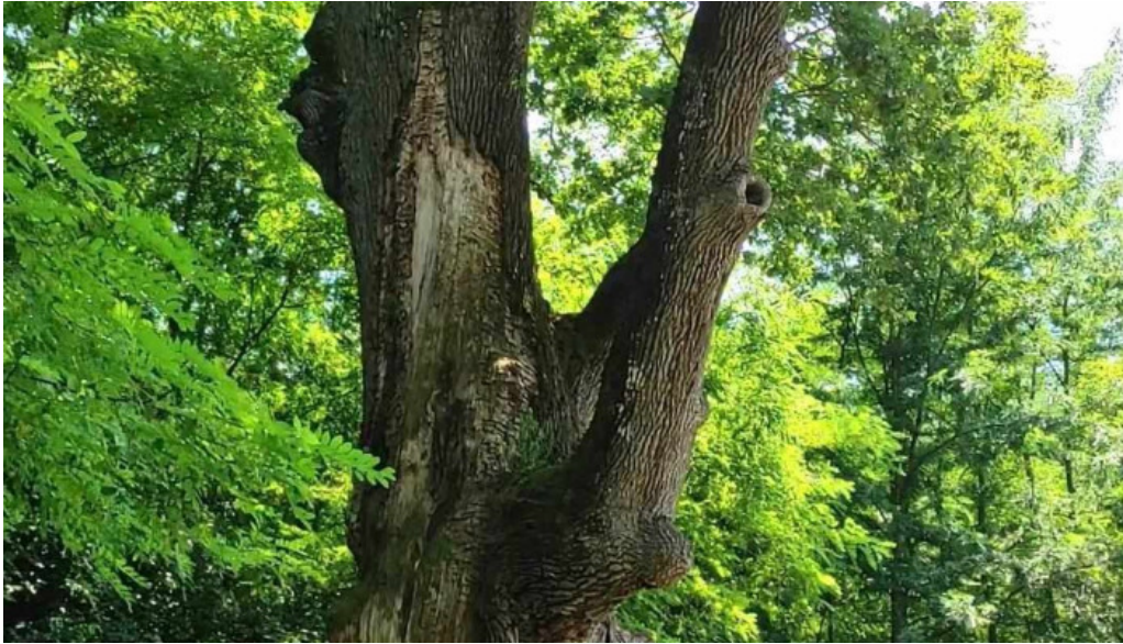
Stejarul de la cocorastii mislii videoclipuri