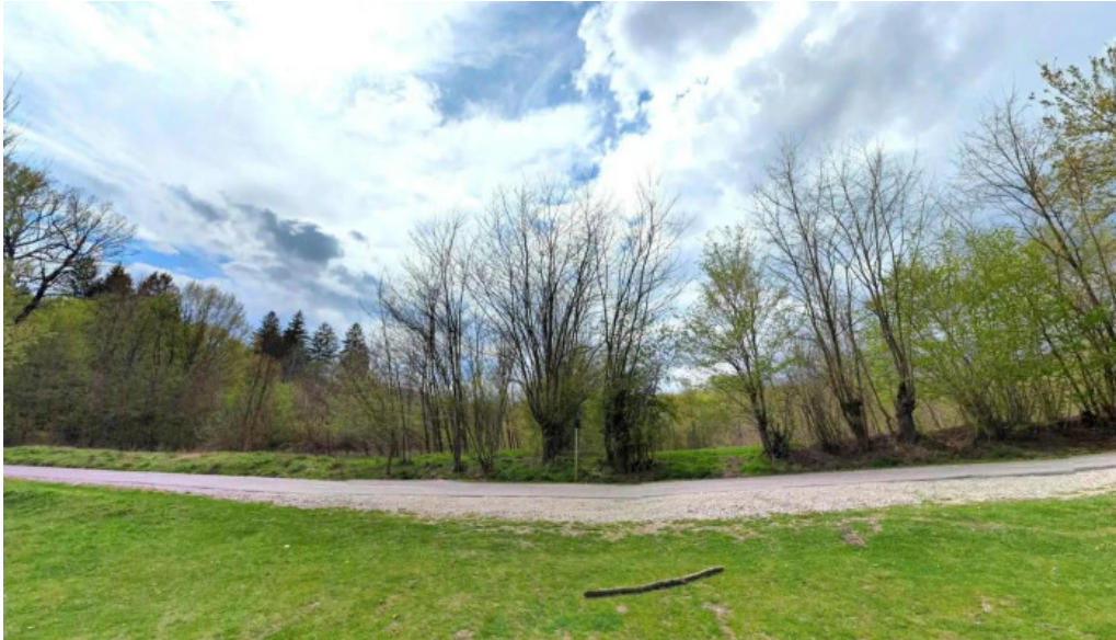
Stejarul de la cocorastii mislii street view si 360deg