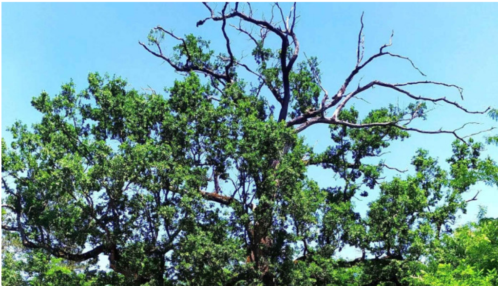
Stejarul de la cocorastii mislii cum s? ajungi acolo