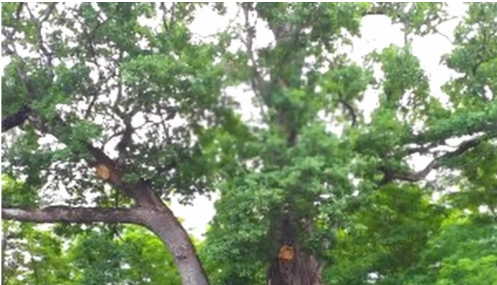
Stejarul de la cocorastii mislii loca?ie