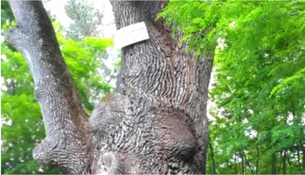
Stejarul de la cocorastii mislii pre?uri