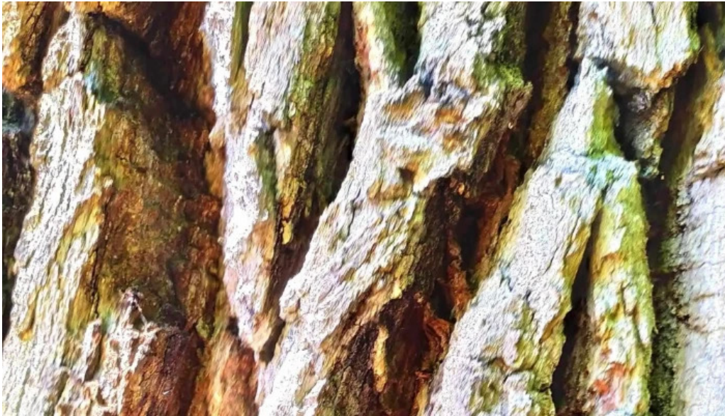
Stejarul de la cocorastii mislii recenzii