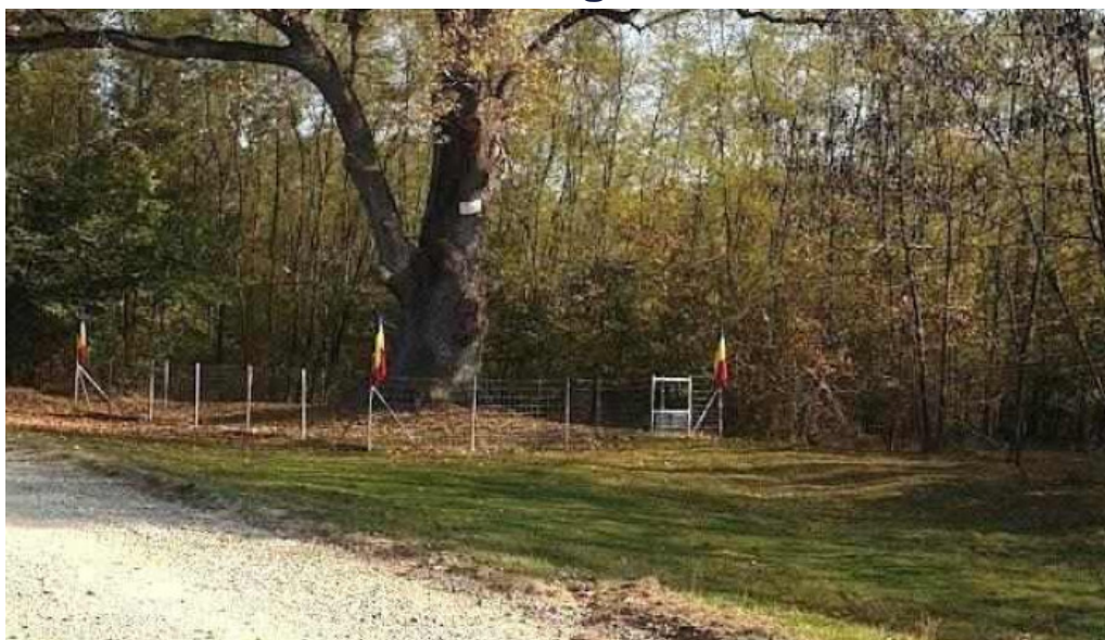
Stejarul de la cocor??tii mislii dc133