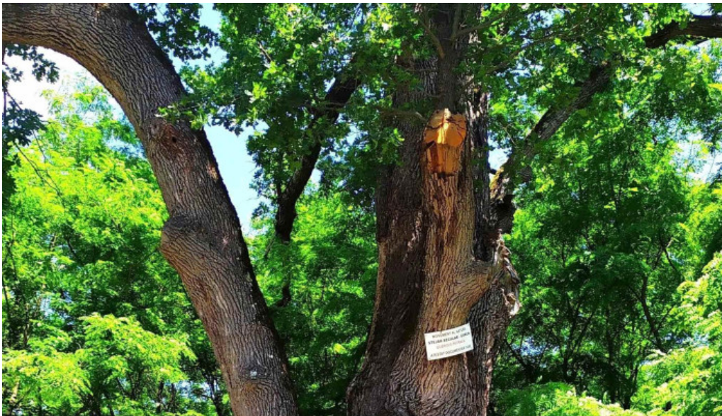
Stejarul de la cocorastii mislii site web