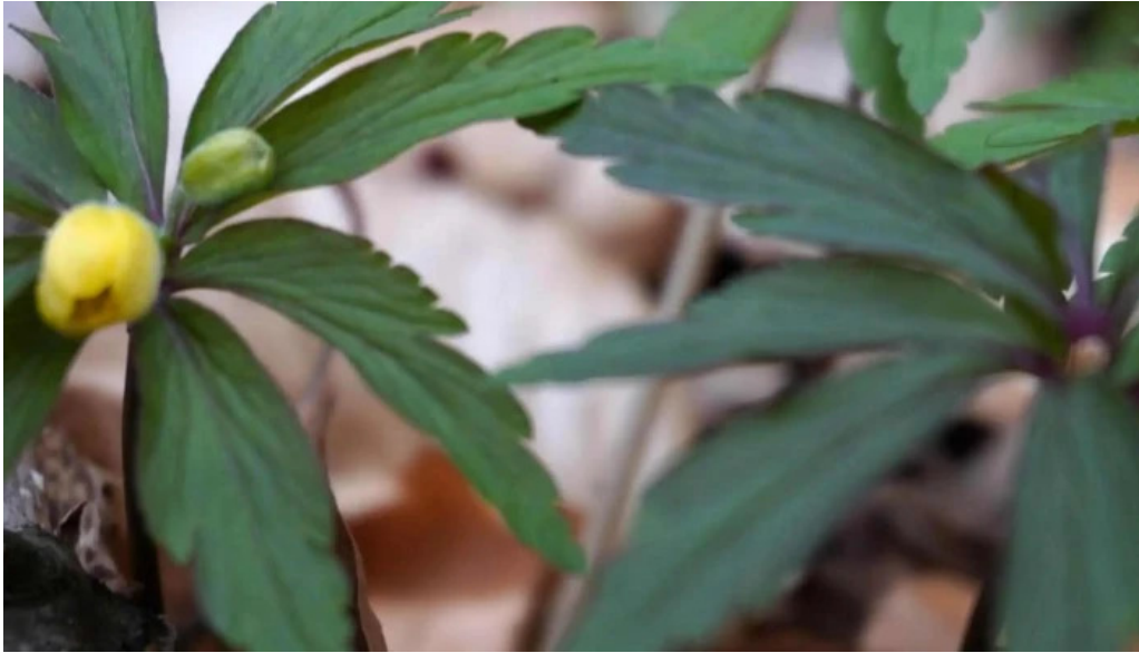
Stejarul de la cocorastii mislii scor